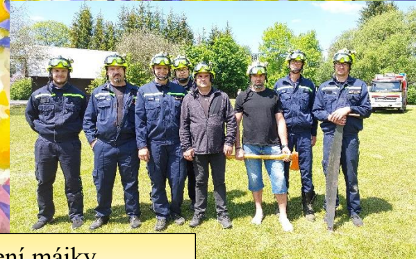
Den dětí a kácení májky