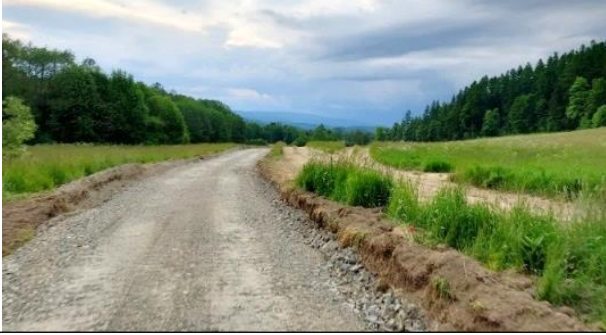
Cyklostezka Dolní Moravice – Velká Štáhle