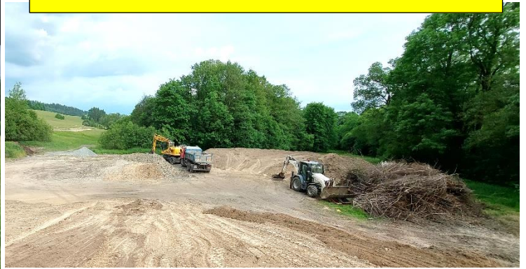
Nová komunikace ke kostelu sv. Jakuba st. a oprava mostu.