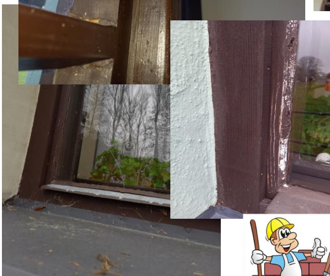
STÁVAJÍCÍ VSTUP DO SKLADU – BUDOUCÍ WC PRO ZTP